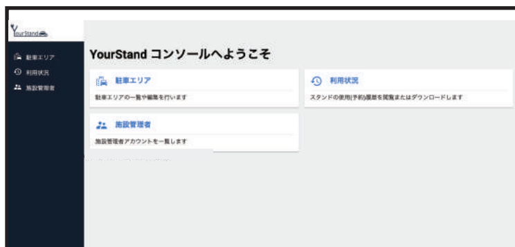
管理者権限のホーム画面