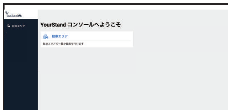
編集者・閲覧者権限のホーム画面